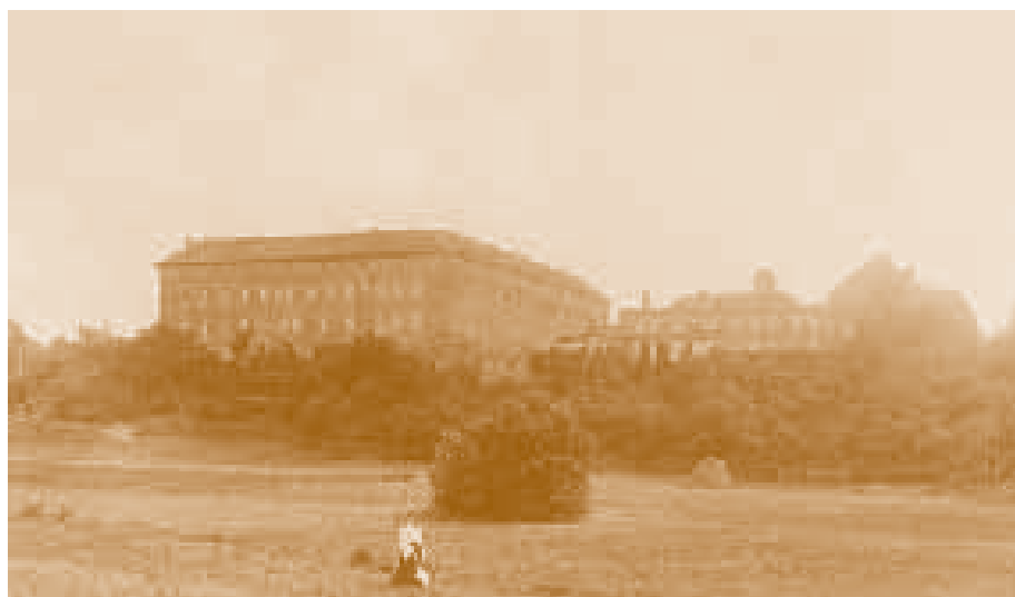
Замок в Рагнете

Позже тыкотинский замок был местом укрытия других правителей: в 1576 году – Стефана Батория, а в 1630 – Зигмунта III Вазы. 1 октября 1705 года, во время встречи с царём Петром I, в тыкотинском замке пребывал король Август II. Шведы и сторонники Лещинского (4 октября он был коронован архиепископом Константином Зелинским в Варшаве) отреклись от него и Август II просил помощи у русских, чтобы бороться со Станиславом. Он хотел отблагодарить некоторых магнатов за доброжелательность. Поэтому он вручил собравшимся в Тыкотине красные эмалированные медали с изображением Бе-