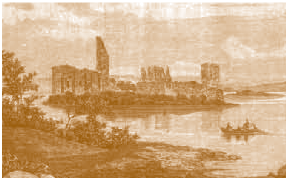
Замок в Тракаи