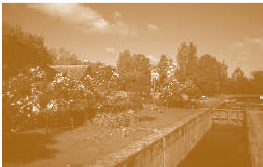
Шлюз в Августове зимой.

Кишитоф Вольфрам, Фонд Зелёные Лёгкие Польши