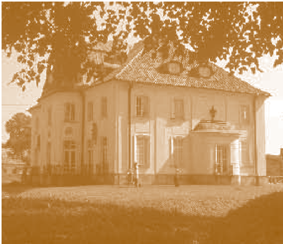
Замок в Хороше.

У гетмана есть две красивые резиденции. Дворец в Белостоке