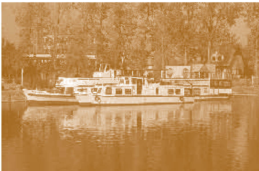
Судоходный порт в Августове.

Канал по всей его длине должны были обслуживать 12 шлюзов