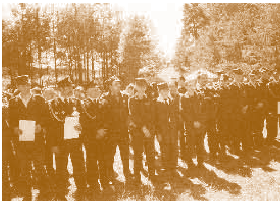
Соревнования пожарников в Старой Хмелювке – 2003 г.

мундиров и 11 торжественных. Планировалось отдать в пользование новое депо, находившееся на месте сегодняшней почты. Всего в 1961 году пожарные потушили 5 пожаров и организовали одну пожарную тревогу.