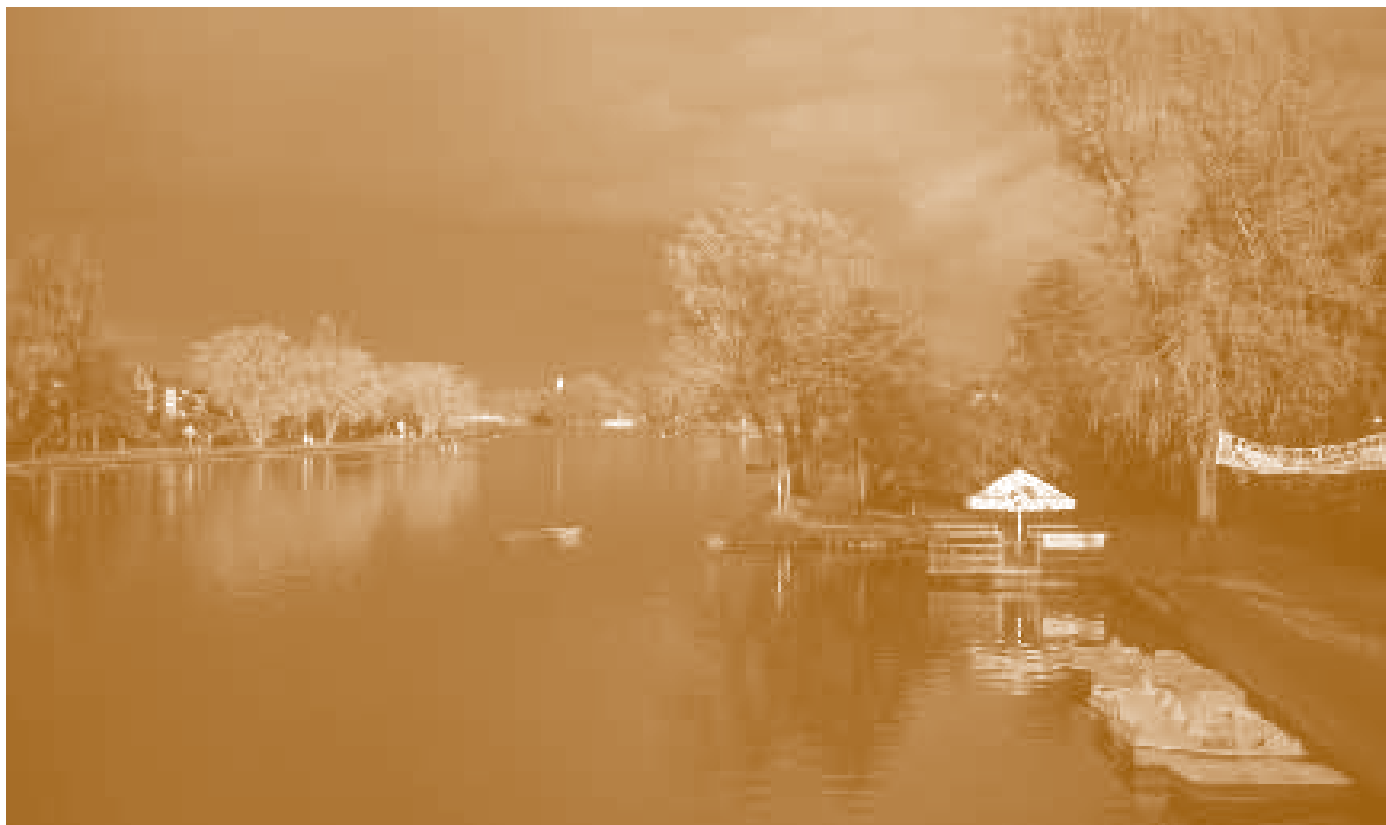
Река Немта – Августовский канал.

ли к Чёрной Ханьче со стороны Вислы. К сожалению, конец таможенной войны, упадок Польши после ноябрьского восстания и отсутствие эффективной рекламы нового водного пути привели к тому, что уже в 1862 году была объявлена его ограниченная пригодность.