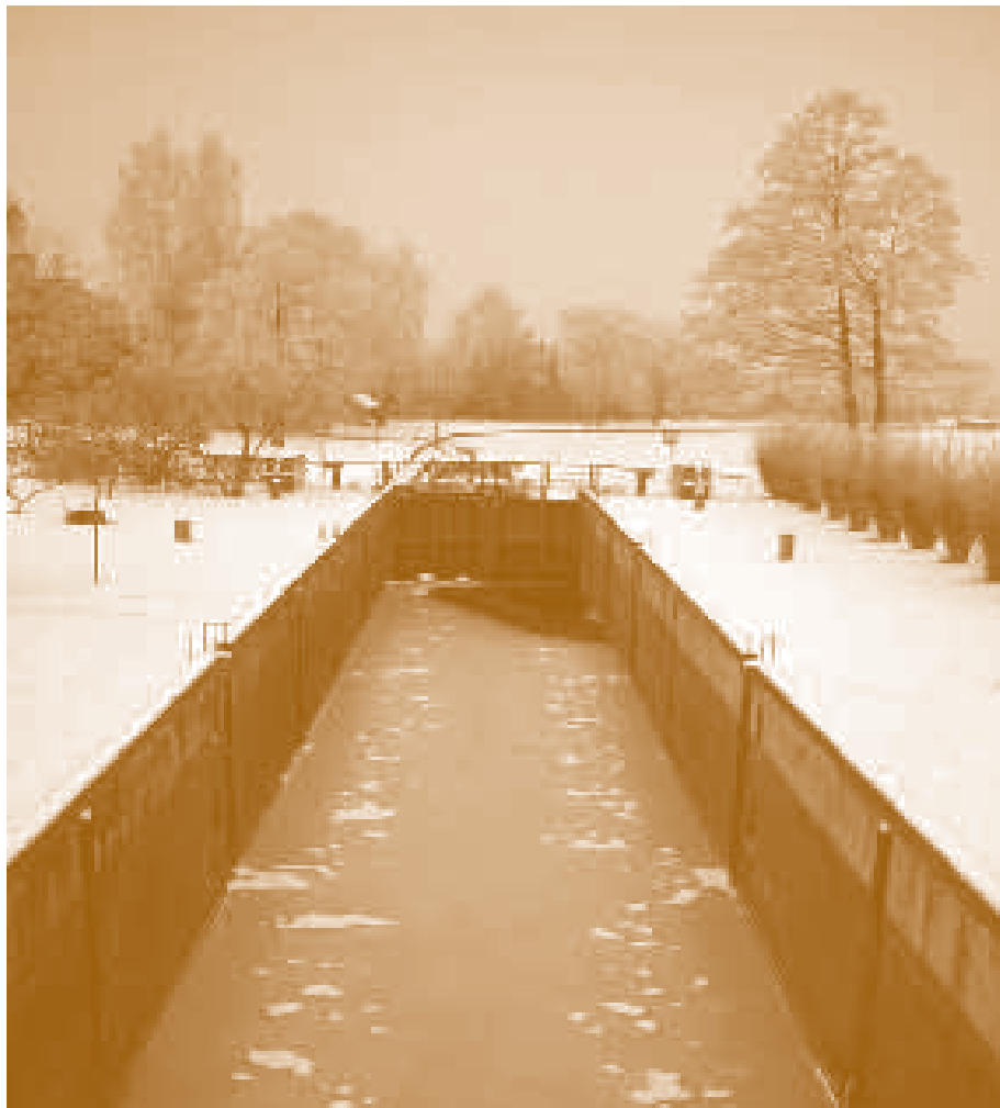
Шлюз в Августове зимой.

И уже в июне 1823 года Игнатий Прондзыньский доложил