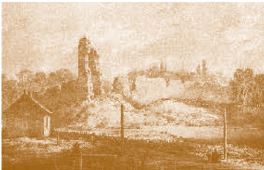
Медники. Литовский замок XIV в. Рис. Н. Орда

Они были построены среди живущего здесь мазовецкого этноса, должны были следить за порядком и защищать от соседей. Несмотря на это, они часто переходили из рук в руки, принадлежали то русским, то польским князьям.